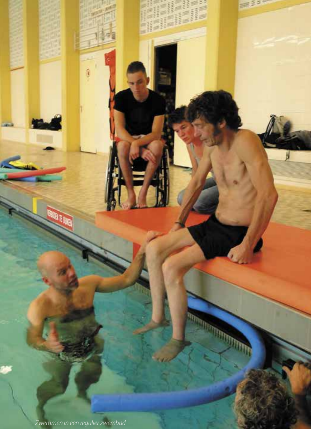
Zwemmen in een regulier zwembad

leertraject is een zoektocht om dingen anders te gaan doen of anders aan te pakken. Leren betekent dat men zich anders gaat gedragen, gericht op een ander effect. Veranderen om het effect te bereiken dat men voor ogen heeft.”